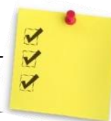
TABLEAU SYNTHÈSE FRAIS DU SERVICE DE GARDE

Un enfant peut se voir retirer le droit de fréquenter temporairement le service de garde ou en être exclu pour toute raison jugée valable par la direction comme le non-paiement par les parents des services facturés, le comportement inadéquat de l'enfant, des gestes de violence reconnus ou autres motifs.